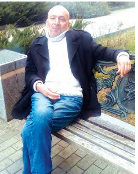
მოვიდა სეტყვა, გამომაფხიზლა და უცნობ ნაპირს მოადგა გემი!!!

*** დამეწყო ბოდა, დამეცყო ცრემლი... მე ვერ ავიტან ამდენ სიცრუეს. ჩემს სანაპიროს მოადგა გემი და მას მოუნდა, რომ ამბატროს. მაგრამ როგორც კი „მოხვდა“ იმედი, იცვალა გეზი და გასცდა ნაპირს და წარემართა სხვის გასართობად, რომ ეს სიცოცხლე გაუხანგრძლივოს. ნაზად და სახტად, მშვიდად და მარდად და მე დამრჩება ისევ სილაღე, ის ლალი ეშუი და პაემანი. შევცქერი თბილისს, მომინდა სიტყვა, მოგონებებით საესე აჩრდილი,