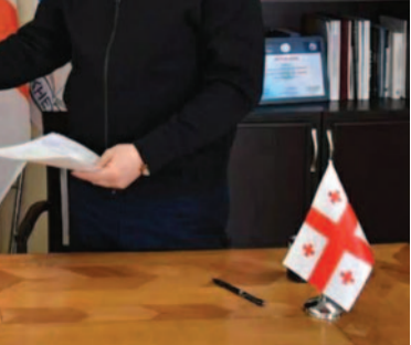
ინფორმაციები უნივერსიტეტის facebook-ის გვერდიდან